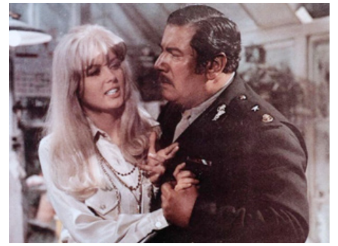
1969 VIVA MAX (Viva Max) de Jerry Paris avec Peter Ustinov