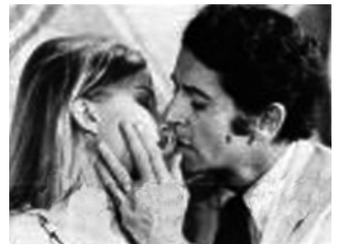
1972 KILL ME, MY LOVE (Amore mio, uccidimi) de Francesco Prosperi avec Farley Granger