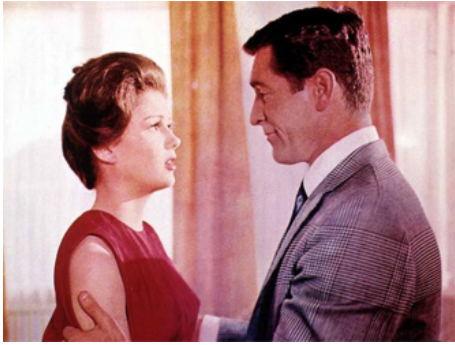
1963 LES FILLES DE L'AIR (Come fly with me) d'Henry Levin avec Hugh O'Brian