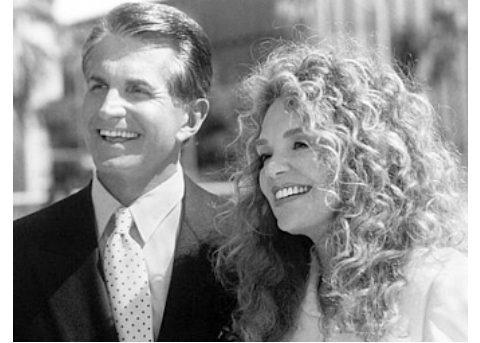
1969 THE LAST OF THE POWERSEEKERS de Paul Henreid avec George Hamilton