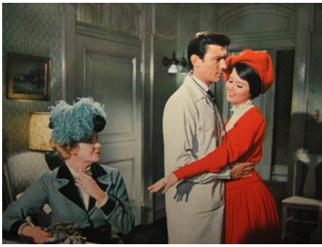
1961 ÉTÉ ET FUMÉES (Summer and Smoke) de Peter Glenville avec Laurence Harvey