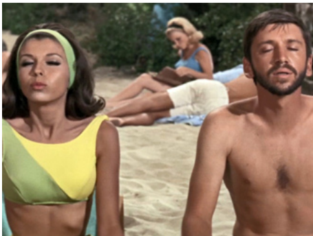
1964 FOR THOSE WHO THINK YOUNG de Leslie H. Martinson avec James Darren