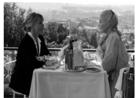
1989 ROSE (Quattro storie di donne) d'Ennio de Concini avec Valerie Perrine