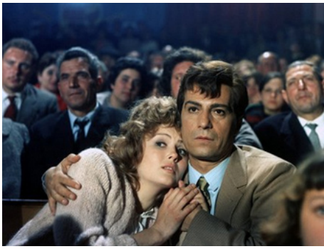
1968 FAIS-MOI TRÈS MAL MAIS COUVRE-MOI DE BAIERS (Straziemi) de Dino Risi avec N. Manfredi