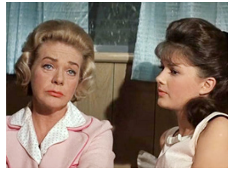
1962 LA FOIRE AUX ILLUSIONS (State Fair) de José Ferrer avec Alice Faye