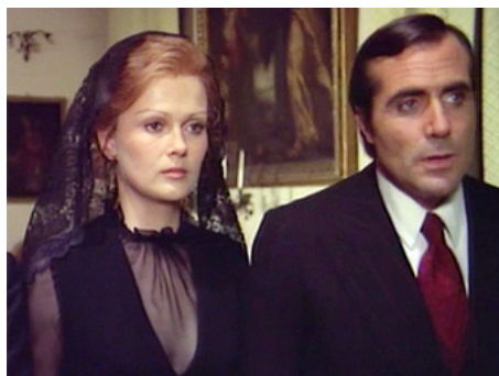
1973 LA SIGNORA È STATA VIOLENTATA de Vittorio Sindoni avec Carlo Giuffrè