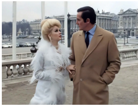
1969 PLEINS FEUX SUR L'ARCHANGE (L'Archangelo) de Giorgio Capitani avec Vittorio Gassman