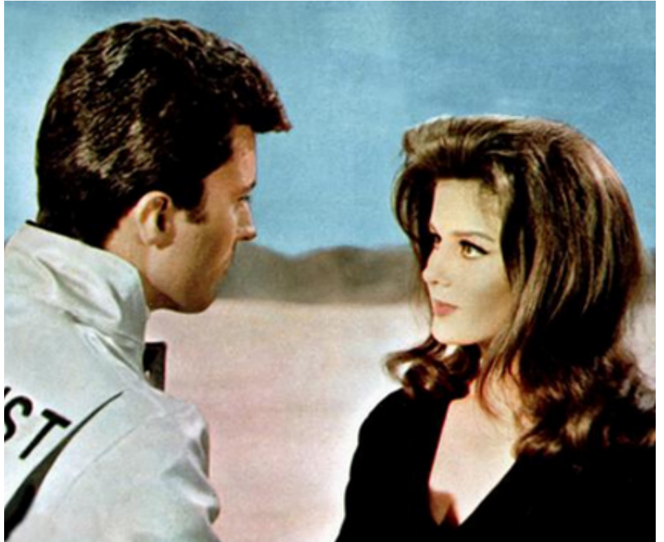
1964 PLEINS PHARES (The Lively Set) de Jack Arnold avec James Darren