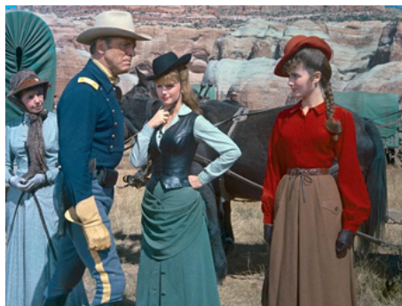
1965 SUR LA PISTE DE LA GRANDE CARAVANE (The Hallujah Trail) de J. Sturges avec B. Lancaster, L. Remick