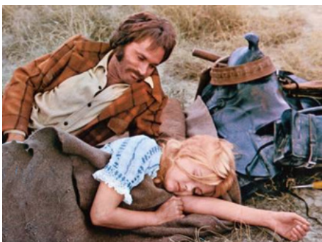
1973 LOS AMIGOS (Los Amigos) de Paolo Cavara avec Franco Nero