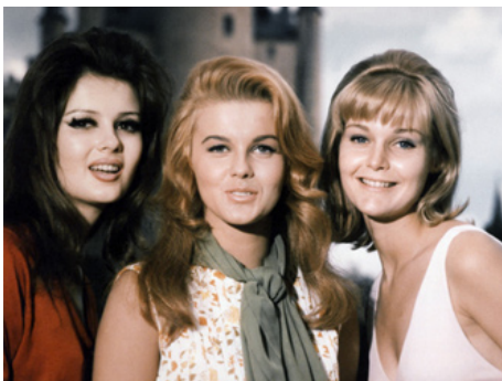
1964 TROIS FILLES À MADRID (The Pleasure Seekers) de Jean Negulesco avec Ann-Margret, Carol Lynley