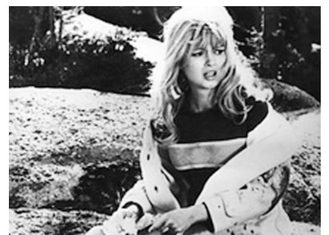
1968 LES PROTAGONISTES (I Protagonisti) de Marcello Fondato