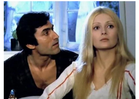
1971 COMMENT ÉPOUSER UNE SUÉDOISE (Il Vichingo venuto dal sud) de Steno avec Lando Buzzanca