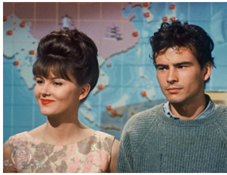
1961 UN, DEUX, TROIS (One, two, three) de Billy Wilder avec Horst Buchholz