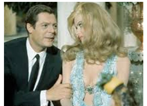
1965 AUJOURD'HUI, DEMAIN ET APRÈS-DEMAIN (Oggi, domani, dopodomani) de Salce avec Marcello Mastroianni