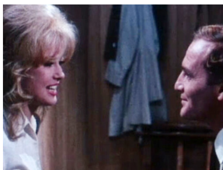
1966 RAPTO À DAMAS (Delitto quasi perfetto) de Mario Camerini avec Philippe Leroy