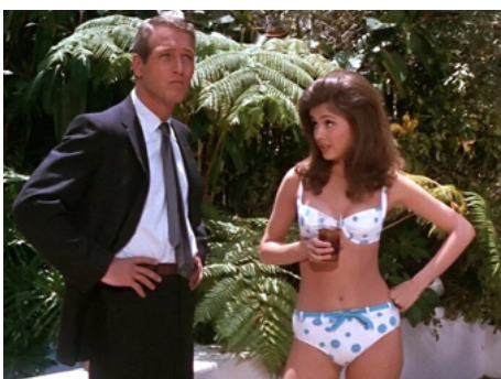
1966 DÉTECTIVE PRIVÉ (Harper) de Jack Smight avec Paul Newman