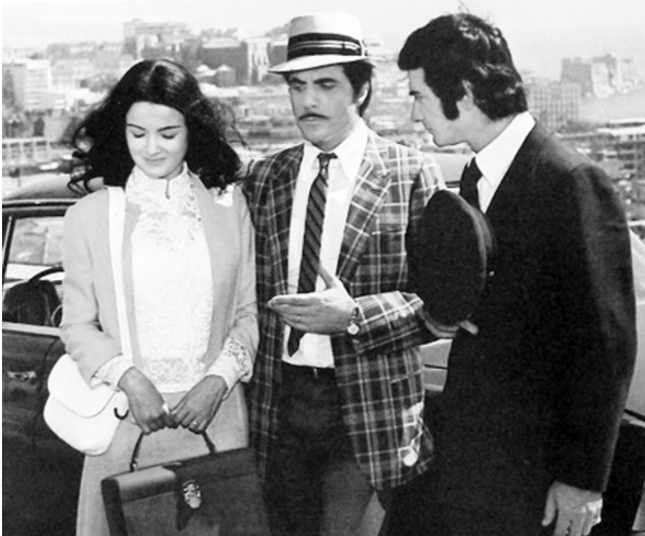
1971 COMMENT ENTRER DANS LA MAFIA ? (Cose di Cosa Nostra) de Steno avec Carlo Giuffrè, Jean-Claude Brialy